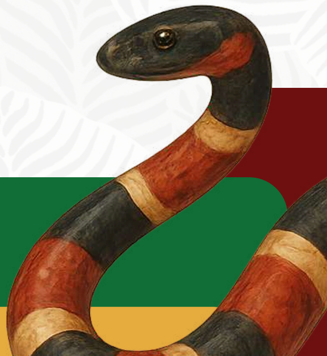
Adriano Silva Babalorixá – Ilê Império de Cobra Coral Itapemirim/ES, 30 de outubro de 2025