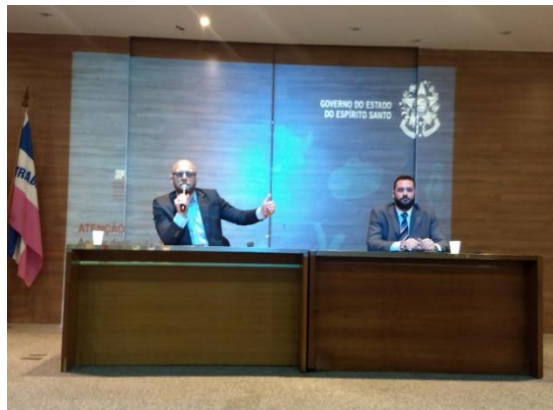
Figura 2: Workshop Políticas sobre Drogas – Drogas e controle social: um histórico da criminalização e do modelo da guerra, 12 de abril de 2019