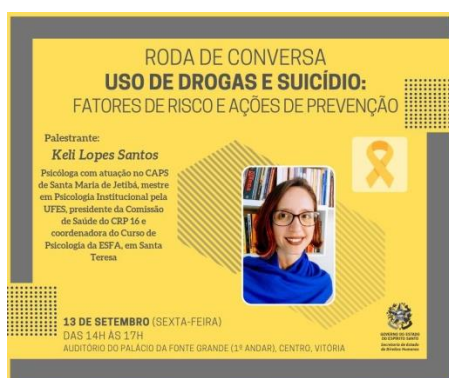
Figura 15: Divulgação Roda de Conversa - Uso de Drogas e Suicídio: fatores de risco e ações de prevenção, 13 de setembro de 2019