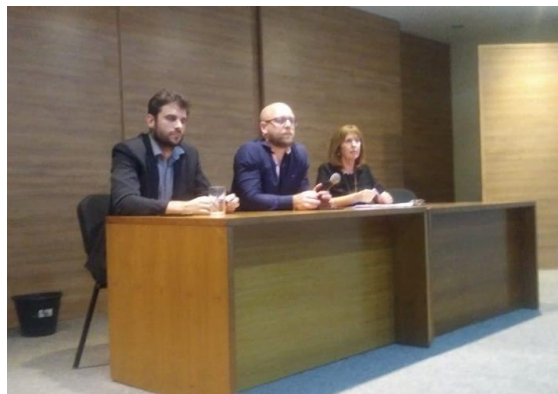
Figura 8: Workshop Políticas sobre Drogas – Drogas e saúde mental: uma articulação em rede, 28 de junho de 2019