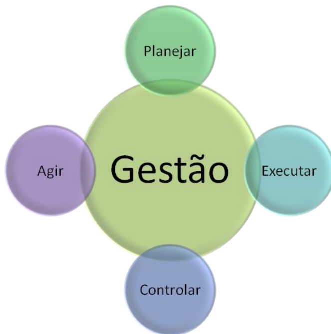
Figura 2: Aspectos da gestão

A SESD está organizada a partir de “estruturas, funções, processos e tradições organizacionais que visam garantir que as ações planejadas (programas) sejam executadas de tal maneira que atinjam seus objetivos e resultados de forma transparente”. (WORLD BANK, 2013). Essa organização apresentada como modo de gestão contribui para operacionalizar o Programa tendo como princípios basilares a ética e a lisura.