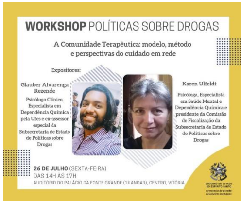
Figura 11: Divulgação do Workshop Políticas sobre Drogas – A Comunidade Terapêutica: modelo, método e perspectivas do cuidado em rede, 26 de julho de 2019