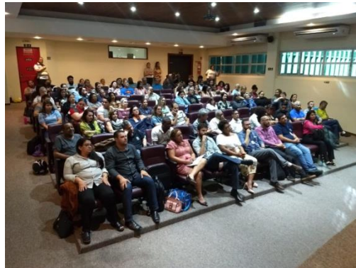
Figura 18: Seminário - A guerra às drogas e o extermínio da população negra no Brasil, 07 de novembro de 2019