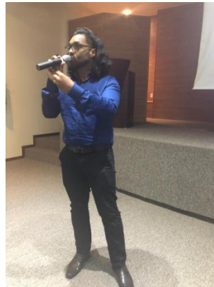
Figura 12: Workshop Políticas sobre Drogas – A Comunidade Terapêutica: modelo, método e perspectivas do cuidado em rede, 26 de julho de 2019