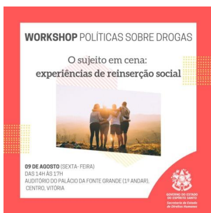
Figura 13: Divulgação do Workshop Políticas sobre Drogas – O sujeito em cena: experiências de reinserção social, 09 de agosto de 2019