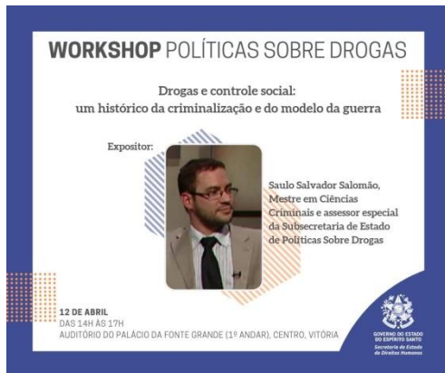
Figura 1: Divulgação do Workshop Políticas sobre Drogas – Drogas e controle social: um histórico da criminalização e do modelo da guerra, 12 de abril de 2019