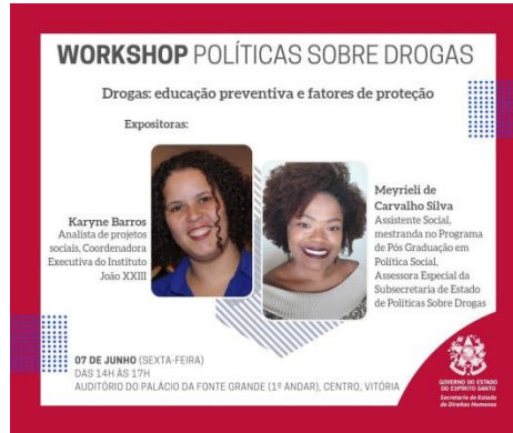
Figura 6: Divulgação do Workshop Políticas sobre Drogas – Drogas: educação preventiva e fatores de proteção, 07 de junho de 2019