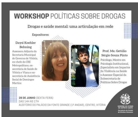
Figura 7: Divulgação do Workshop Políticas sobre Drogas – Drogas e saúde mental: uma articulação em rede, 28 de junho de 2019