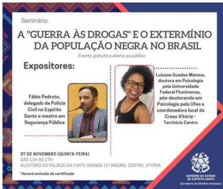
Figura 17: Divulgação Seminário - A guerra às drogas e o extermínio da população negra no Brasil, 07 de novembro de 2019