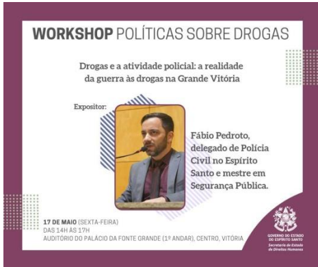
Figura 5: Divulgação do Workshop Políticas sobre Drogas – Drogas e a atividade policial: a realidade da guerra às drogas na Grande Vitória, 17 de maio de 2019