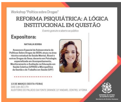
Figura 19: Divulgação Workshop Política sobre Drogas - Reforma Psiquiátrica: a lógica institucional em questão