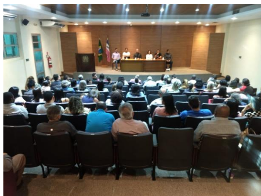
Figura 14: Workshop Políticas sobre Drogas – O sujeito em cena: experiências de reinserção social, 09 de agosto de 2019