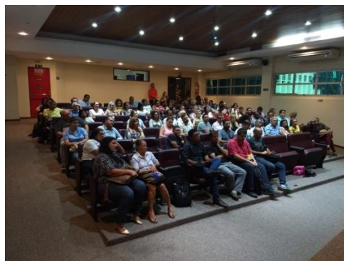
Figura 10: Workshop Políticas sobre Drogas – A nova política nacional sobre drogas: avanços e/ou retrocessos?, 12 de julho de 2019