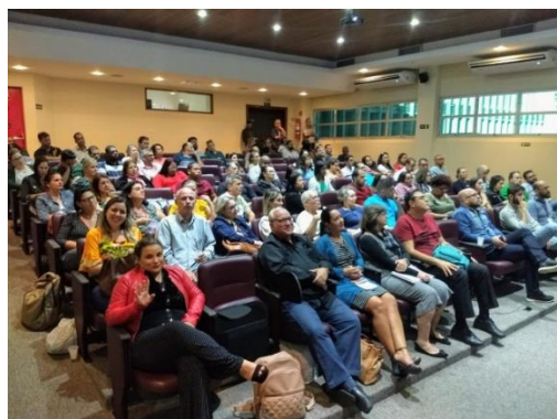
Figura 16: Roda de Conversa - Uso de Drogas e Suicídio: fatores de risco e ações de prevenção, 13 de setembro de 2019