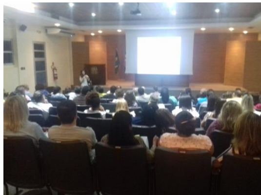
Figura 4: Workshop Políticas sobre Drogas – ABC das Drogas: espécies, classificações, ação no cérebro, tipos de usuários e o processo de dependência química, 08 de maio de 2019