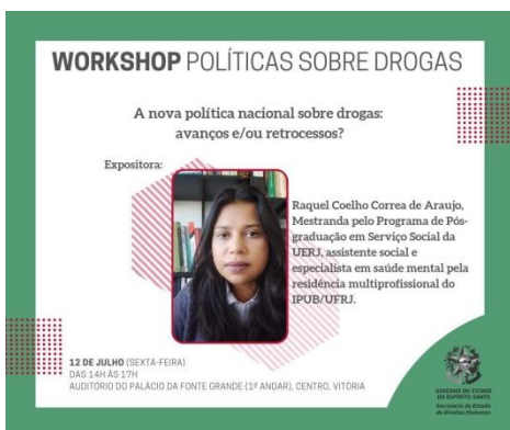
Figura 9: Divulgação do Workshop Políticas sobre Drogas – A nova política nacional sobre drogas: avanços e/ou retrocessos?, 12 de julho de 2019